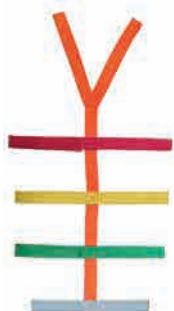
Sangle araignée enfant réf. 509026